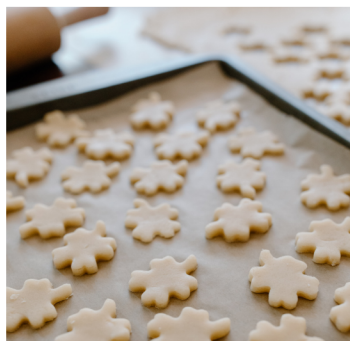
Forre a forma