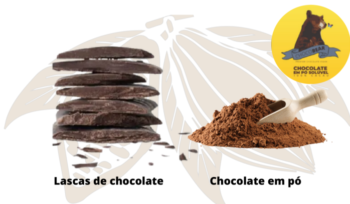
Lascas de chocolate

E há a substituição também das gostas de chocolate pelo chocolate 100% cacau em barras, excelente para criação de outras receitas como Biscoitos, chocolate caseiro, bolos, doces, ganches, coberturas, etc. Tem uma grande rentabilidade por ser altamente concentrado. Além de ser totalmente natural, sem açúcar e sem leite. Contem em seus ingredientes apenas cacau e manteiga de cacau.