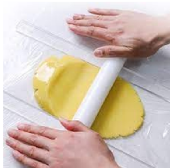
Opção para abrir a massa

·Para dar uma estrutura mais firme ao Biscoito, pode utilizar um açúcar granulado, como demerara ou cristal.