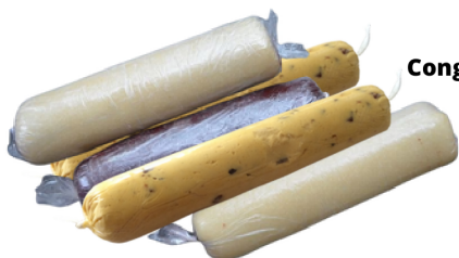
Congelar em forma de cilindro

Essa (qualquer sabor) massa pode ser congelada por aproximadamente 3 meses. Pode ser aberta ou como um cilindro (veja imagem). Basta retirar e deixar descansar de 5 a 10min e já pode cortar e assar.